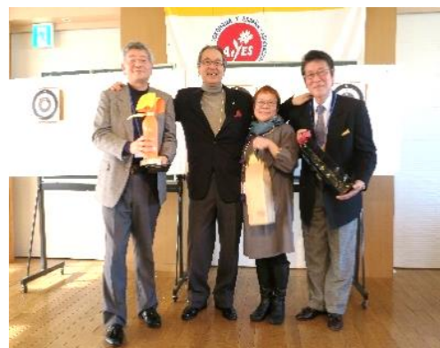
吹き矢大会 優勝2位3位の皆さん