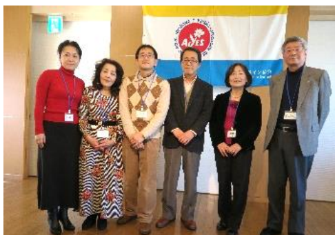
新入会員の皆さん