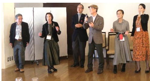
理事の皆さん ご苦労さん