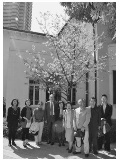
▲協会が植樹した桜の前で公使を囲んで記念撮影